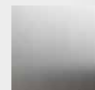
4 MM MASSIV MATT GEBÜRSTET